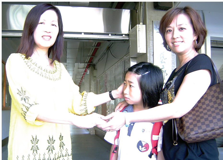
↑教師、家長和學生的對話，是啟動校園親師合作的契機。