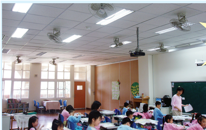
↑T5 燈管汰換完成後，教室變明亮，上課不傷眼力。