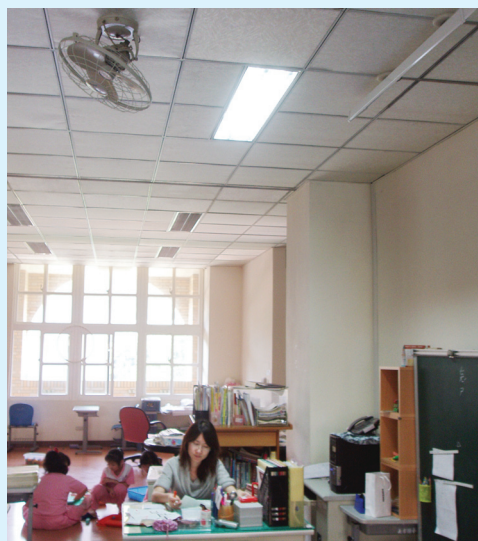
←教師下課級務處理情形，因迴路設計只開上方電燈，可收節能省電之效。