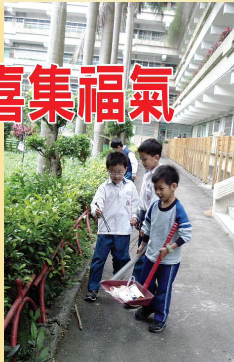
↑環保小志工結伴穿梭在中庭，他們說：「我在撿垃圾！」

清晨，約了窩在教室裡吱吱喳喳談天的學生，一起到校園撿拾垃圾（通常週一的校園泡麵碗筷、飲料罐等垃圾特別多）。自從那次集體行動後，學生開始主動要求晨光時間去撿垃圾，每當他們撿了一堆不屬於校園該有的東西之後，老師會協助他們做垃圾分類，而小小環保志工得到的獎勵是羅老師的一句讚美的話：「謝謝你，校