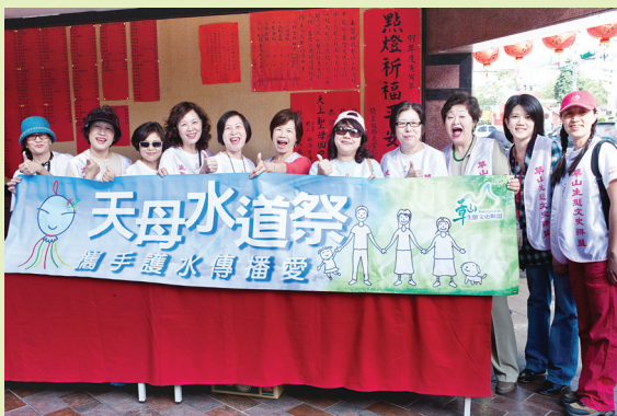
↑草山生態文史聯盟的志工媽媽，共同耕耘了八年的天母水道祭活動。