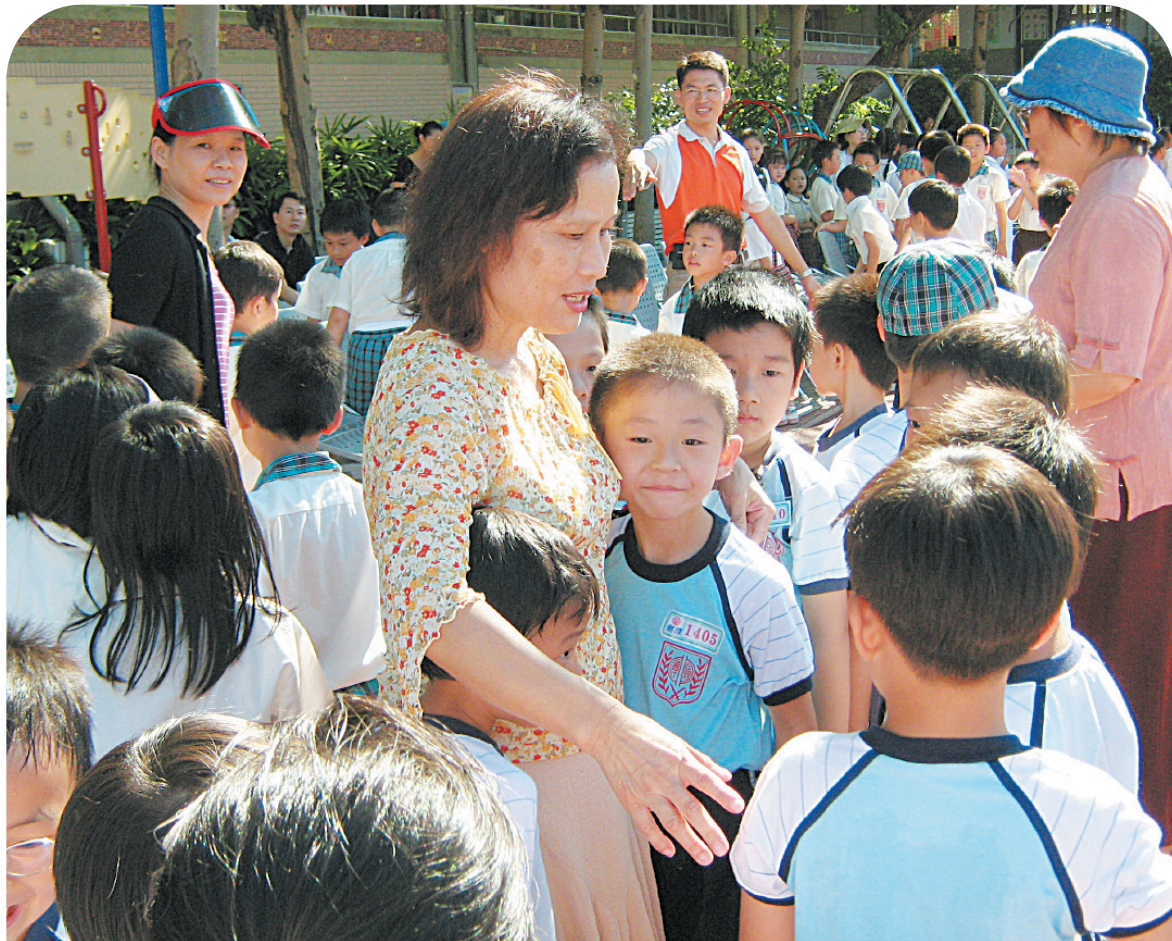
↑教師以正向管教的方式，來經營班級，主動傾聽、關懷，營造友善的學習環境，師生零距離。