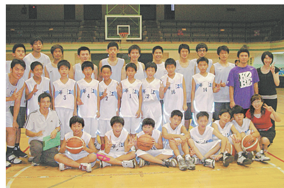
↑華江國小籃球隊隊員與 2009 聽奧籃球代表隊合影。