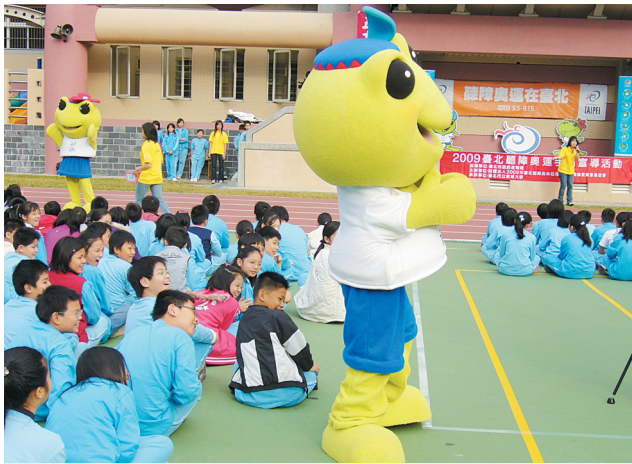
↑ 石牌國小校慶，結合聽障奧運宣導活動。

第 21 屆（2009 年）聽障奧運，已在今年 9 月 5 日登場，來自全球共 91 個國家、2600 多名選手齊聚於臺北市，有田徑、羽球、籃球、沙灘排球、保齡球、自由車等 20 種競賽項目，在各個比賽場地中大放光彩。我國曾在 2005 年墨爾本的第 20 屆聽障奧運會中，奪下 9 金 4 銀 3 銅，國家總排名第 5 名的佳績，僅次於烏克蘭、俄羅斯、南非和美國等運動列強。