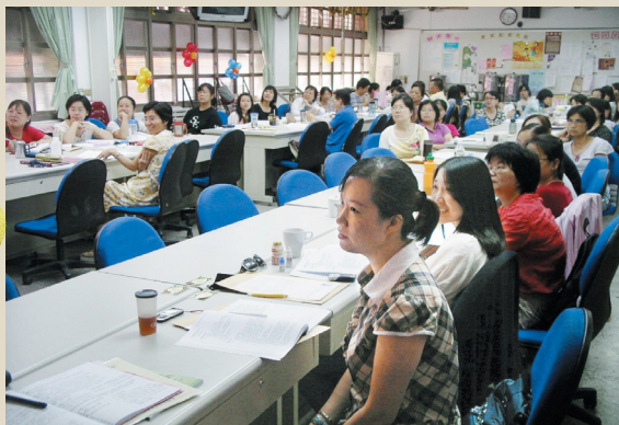
↑ 教師聚精會神參與品德禮儀工作坊研習活動。