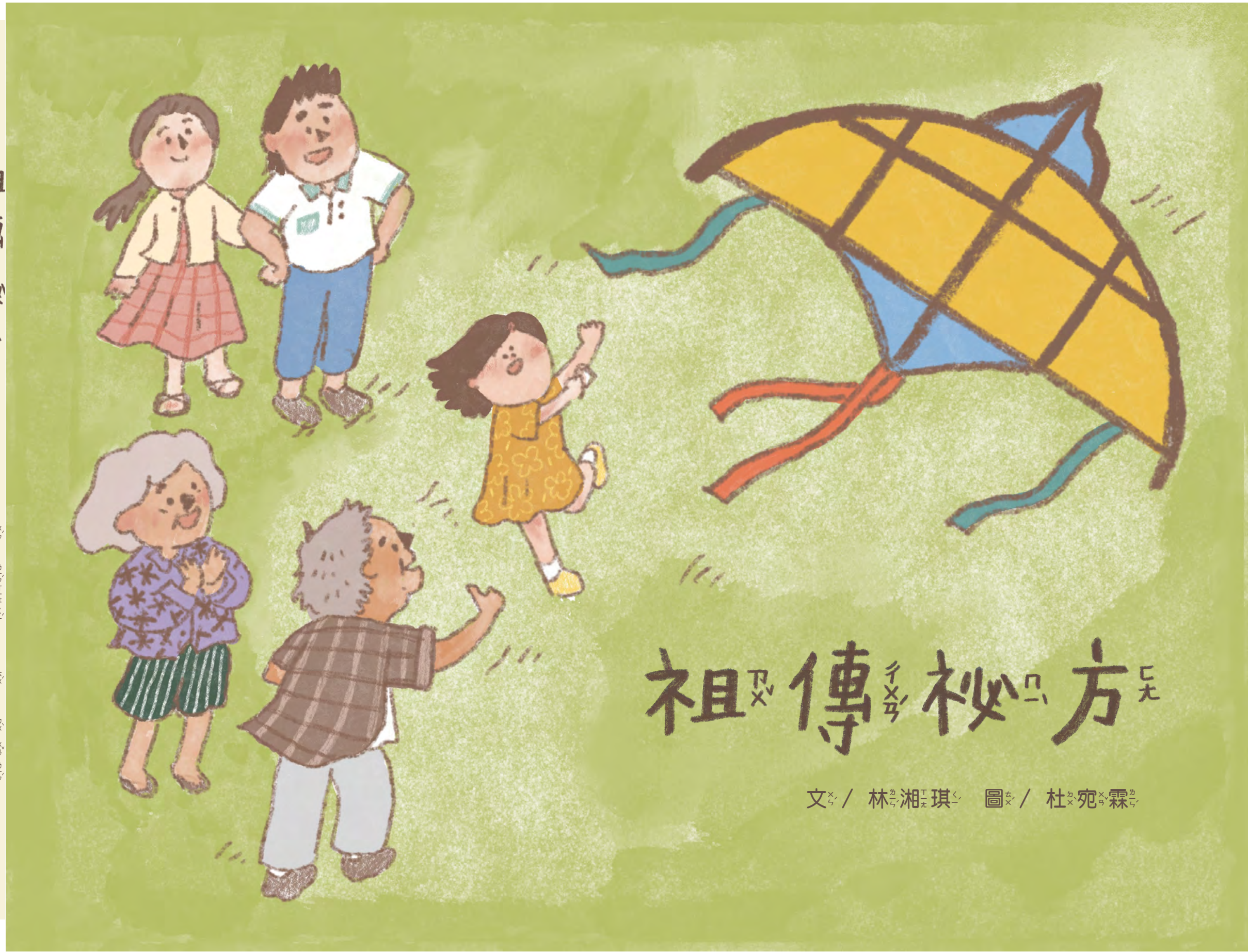
圖 / 杜宛霖