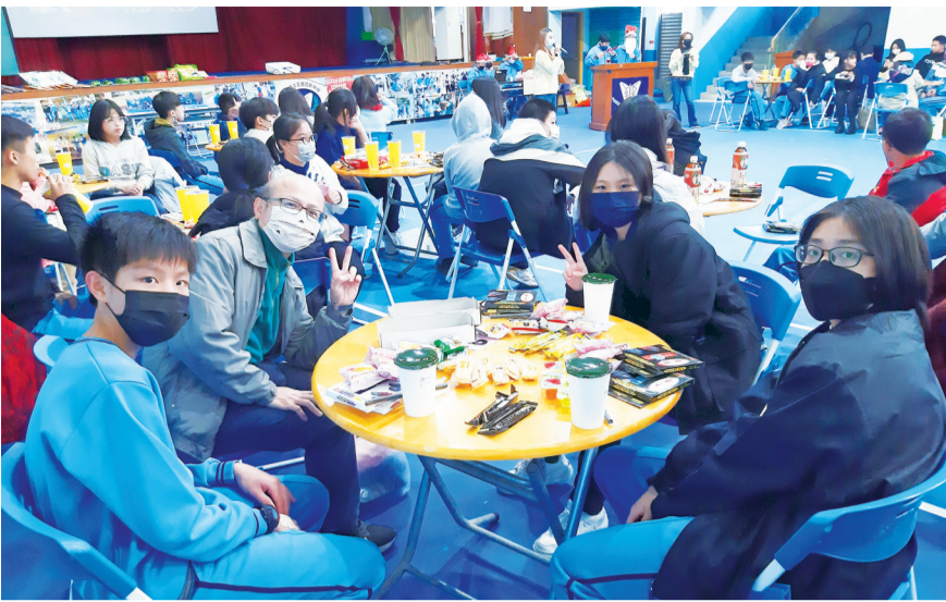
▲學校在歲末舉辦感恩活動，各家族聚會欣賞表演、分享與感謝。

至善國中一年一度「天使家族活動」開始了！新生入學後，學校以抽籤的方式將學生分入不同家族，家族內有一位家長，由全校教職員工(包含校長、教師、行政人員等)擔任，以及三名至四名七至九年級的學生組成家庭成員，並於開學時由校長啟動。 在聚會中，由家族中的家長與哥哥、姐姐一同迎接家族新成員，透過破冰之旅，暢談生活點滴，藉以了解彼此，進而建立信任，並了解「天使家族」是在解除天使家族，是在解除各班級同學與任課教師外，另一個學校生活的避風港。此外，家長也會透過小卡勉勵學生，並在課餘時間關心家族成員。 在歲末之際，全校師生參與歲末感恩活動，由學生發表這一年的學習成果，在享用零食飲品、欣賞表演之餘，學生再次與家族成員互動，暢聊一年來的趣聞與所學，並透過小卡及口頭分享，感謝家族家長與教師一年來的照顧。 活動結束後，家族成員在視覺與味覺上皆得到一場饗宴，並獲得了彼此的支持與感恩的能量，身心靈都感受到無比富足，得以持續面對未來在生活及學業的挑戰。 本校持續推動校內教師與行政同仁參與「關懷學生人人天使心」的關懷照顧活動，以支援各班導師及學生家長照顧每一名学生，達到「教育——政策」中一個不能少的目標，營造校園內溫馨友善的師生互動氣氛。此外，亦培養學生互相關照、時時感恩的優良品德，將品德教育融入生活中，因為教育是一生命感動生命」的歷程，是生活日常情境學習的具體實踐，而良善品德涵養也是在潛移默化中，一種身教、言教的仿效感動修煉。希望學生未來也以懷著這樣的心態，主動關心身邊的人並感謝生活中的大小事，凡事感恩，常常喜樂，處處充滿善的循環，人人發揮關鍵影響力，實現自我，共榮共好。