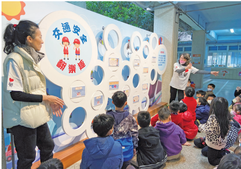
▲天母國小利用交安素養翻翻板，宣導行人路口安全教育。

茲將交通安全四大創新、十大成果，分別敘述如下。 四大創新 人力資源，挹注滿點：推動交安小尖兵、全校班級家長守護及安親班守護，共同協助學生上放學安全；加入天母學區安全聯盟，持續改善學校周邊交通環境。 創意教學，多元展能：自編《交通安全學習手冊》，全校教師公開授課，提升教學專業；設計交通安全創意活動，融入各領域課程及學校活動實施。 資源整合，友善文化：建置交安學習情境，校本交安課程配合十大交安情境設施；學校自編交安課程，安排多元學習的體驗活動；配合節慶活動及藝文競賽，規畫多元學習活動，並檢核學習成效。 資訊創客，智慧創新：建置天母元宇宙——虛擬實境交安 VR 體驗區、圖傳系統遙控車互動體驗課程，有效提升學習興趣與成效。透過教育博覽會、教育廣播電臺、教師天地等資訊媒體平臺，分享並宣傳交安推動經驗。