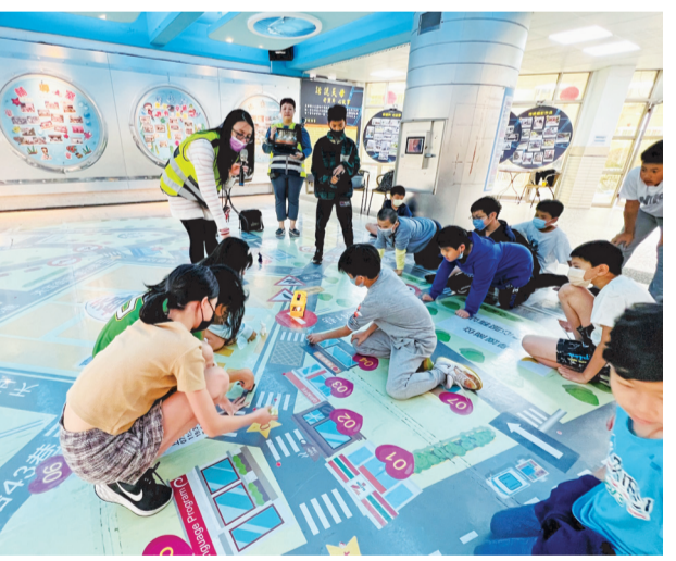
▲學生認識社區、辨識標誌及操作圖傳車系統。

內十大交安情境設施，系統化、結構化及在地化的實施交通安全課程。此外，學校結合新興科技發展交通安全 VR 及圖傳車體驗課程，透過 PBL 及 DFC 教學，引領學生主動探索，並以創意行動解決校園內外產生的安全問題，提升學生對交通安全的感受與知能。