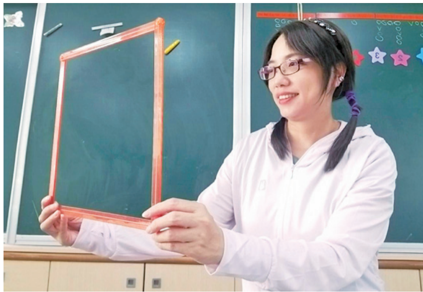
▲教師將正方形框轉個角度，學生看到就覺得不像正方形。

在上數學課時，我操作教具「扣條」組成數個正方形，展示給學生看。沒想到，學生舉手告訴我：「老師你手上的不是正方形。」當我轉過身來，正面朝著學生時，學生突然說：「奇怪！怎麼又變成正方形！」原來，從正面看和側面看，形狀略有不同，視覺角度造成的變異，讓正方形不像正方形，但事實上它還是正方形。