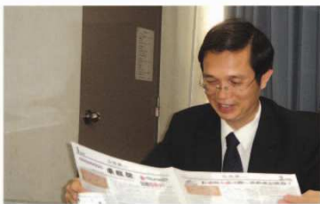
▲ 局長閱讀品德報並提出期許

品格教育的教材應融入在各領域教學中：如，在體育教學中可強調運動家公平正義的精神及深化責任、勇敢的價值；在資訊教學中，亦可導入尊重智慧財產權的議題；