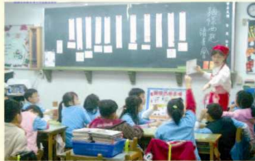
▲ 福林國小品格與閱讀觀摩教學