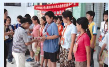
▲ 結訓典禮成果豐碩