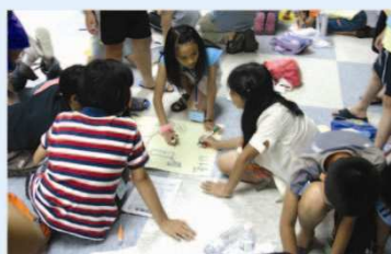
▲ 學生分組實際參與體驗