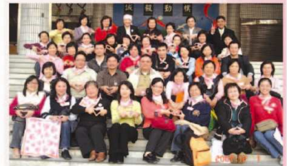
▲ 北市福林國小為「愛你一輩子」首支守護分團，圖為第一屆守護志工培訓合影。

一股善的力量愛的直銷，正在集結，父母唯有回到原點，重拾孩子誕生時，那最單純無私的愛，才能抵擋長期扭曲臺灣孩子生命的升學主義。(福林/李月娥)