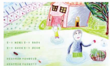
▲ 忠孝學生藉由文字和插畫，詮釋『佐賀的超級阿嬤』

配合臺北市品格教育年，忠孝國小與東暉電影公司合作舉辦「看電影學品德—電影繪本書」徵文徵畫活動，選擇14部精彩精緻、不同國家的優質電影，搭配14項品格核心價值，藉由六年級準畢業生的文才華與藝術天份，發揮語文能力與繪圖創意，呈現出電影的內涵與品德的價值，最後選將優秀同學的作品集結出書，名之為『電影創意魔法書—繪聲匯影會品德』。