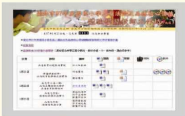
▲ 人權法治及品德教育體驗工作坊成果網頁

推動品格教育應從根本做起，與閱讀課程結合，是最好的策略，行政系統規劃架構套書，充分提供資源、整合資源，並讓品格教育真正融入課程；成立閱讀工作坊培訓師資，安排專業督導強化專業；其他如透過組織再造充分整合人力資源，讓教、訓、輔、老、師及家長大家一起來，經過多次閱讀研討會、工作坊、專題演講，老師們有許多機會學習、觀摩、討論、分享怎麼教「品