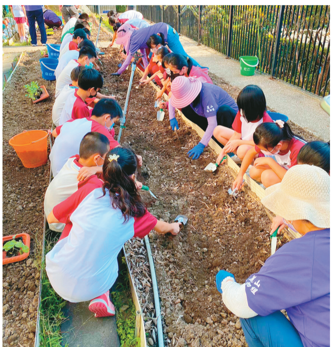
▲麗山國小校園開闢菜園，實施小田園課程，學生體驗翻土播種。

本校願景為「創活自我」、「成就他人」、「全球關懷」，學生圖象為「思辨」、「誠信」、「負責」、「合作」、「同理」、「感恩」、「全球視野」及「關懷行動」，並建構出「有品麗山·幸福閱讀」、「STEAM 手創館」、「理財悠遊趣」、「寰宇麗麗·食在珍惜」等校訂課程架構，希冀能成就麗山學生未來成為獨立思考、積極負責、與人合作及世界關懷的全球公民。我們以學校願景及學生圖象為出發點，於行政會議中討論三好實踐學校的實施內容與主軸，彼此產生理解與認同，並提出