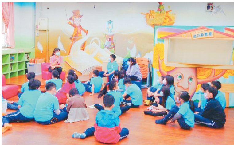
▲學生聽完故事後，教師藉機問：「你想當小刺蝟，還是小浣熊呢？」

「哇！老師，某某玩遊戲的時候又打人啦！」 「老師！上體育課的時候他又和同學吵架了！」 「老師，我們再也不和他同一組了，他都不配合！」 「教室裡，常常聽到學生的告狀，一天累積好幾個，每個人都好生氣，學生的情緒緊繃，我擔心衝突一觸即發，每天都要花費許多時間調解紛爭、處理行為問題，整個班級的氣氛跌到谷底…… 觀察班級裡學生的特徵，有些像刺蝟一樣，情緒激動時，身上的刺就伸出來，傷害到其他人，事後後悔也來不及；有些較和善的學生，或許被刺蝟影響，或許選擇袖手旁觀。你是小刺蝟？還是小浣熊？是以這些學生的形象為基礎，希望帶入品德核心價值中「接納包容」為主題的小故事。