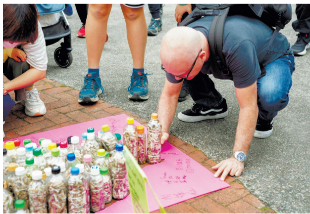
▲拒絕菸害，清除菸蒂不分國界，外國旅客在菸蒂罐排成的臺灣造形裝置上寫下祝福與支持。