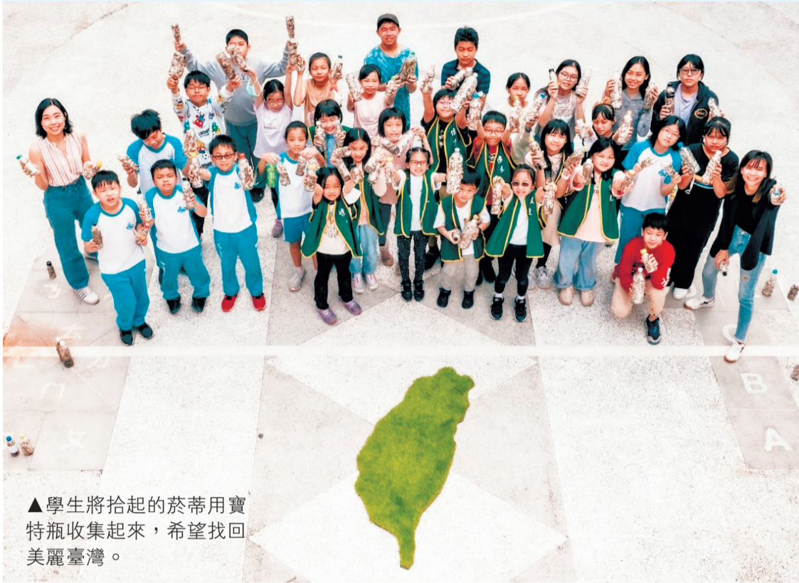
▲學生將拾起的菸蒂用寶特瓶收集起來，希望找回美麗臺灣。