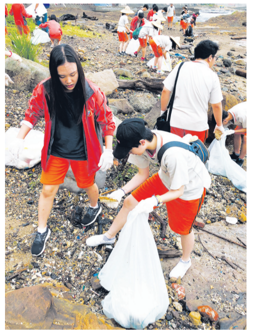
▲淨灘服務隊到基隆潮境公園淨灘。

本期品德報所報導的品德核心價值為「關懷行善」，南湖高中在校長吉佛慈的帶領下，將「關懷行善」作為學校教育發展重點，透過課程設計與服務學習，落實關懷行善。藉由這次訪談南湖高中校長吉佛慈，了解該校實踐關懷行善從知到行的學習歷程。以下為訪談摘要。 訪談人：請介紹南湖高中推動的品德教育特色。 吉校長：南湖高中為地上十層、地下兩層的建築，代表色為學生制服的橙色，所以學生常以「橙堡」稱呼學校，以「橙子」稱呼南湖學生。南湖的品德教育，為校訂必修課程。課程名為「橙堡年禮」，意謂橙堡的成年禮，係以品德教育