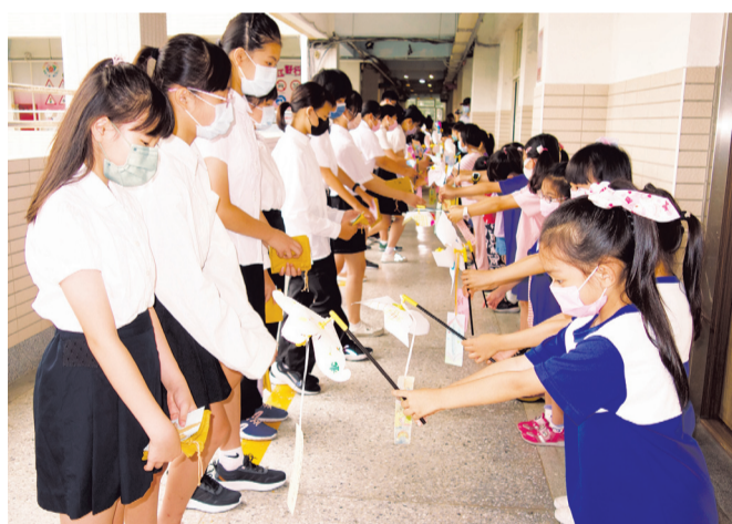
▲六年級學長姐製作洋蔥染提袋，於畢業典禮當天贈送給一年級學弟妹，有「袋袋相傳」之意。

義大利詩人但丁曾說過：「品德可以彌補知識的不足，知識無法填補品德的空白。」在過去強調升學主義及成績至上的思維下，認為只要成績好就能想怎樣就怎樣，忽略了品性的養成。聯合國教科文組織 (UNESCO) 則指出：「道德、倫理、價值觀念是二十一世紀人類面臨的首要挑戰。」因此在華江國小，學生有好品行，比有好成績來得重要，學校將品德教育的精神融入學生生活動及主題課程中實施。 華江國小的學校願景是以「愛、感恩、關懷、健康、快樂、希望」為基礎，達到親、師、生皆實現「多元創新、快樂自信」的目標。學校願景充分融入每學期的課程，其中，一年級及六年級「大手牽小手」活動，則能完整體現品德教育中「關懷」的核心價值。 剛上一年級的新生，對於陌生的環境，總有一些不適應，本課程設計以「適應學校生活」為主軸，藉由六年級學長姐的陪伴與引領，讓一年級新生感受到華江國小的溫暖與關懷。 活動設計如下： 新生入學典禮：安排六年級學長姐與一年級新生大手牽小手相見歡活動，由學長姐手牽著小一新生，一起陪伴參與進入華江第一天的第一場活動。 認識校園：由六年級學長姐擔任關主，介紹學校各處室及校園環境，幫助新生更快認識校園。 圖書館共讀：在閱讀課時，配對的學長姐與學弟妹共同挑選一本繪本，由學長姐帶著學弟妹共讀。 歲末搓湯圓活動：冬至歲末共享甜蜜的湯圓，祝福彼此圓圓滿滿、平平安安一整年！ 鴨鄉袋袋相傳，畢業交換祝福：結合學校洋蔥染特色課程，六年級學長姐製作洋蔥染提袋，於畢業典禮當天贈送給一年級學弟妹，有「袋袋相傳」之意；而學弟妹也利用生活課程製作卡片及回禮，祝福學長姐畢業快樂！ 學校希望透過大手牽小手活動，幫助一年級新生更快融入小學生活，希望營造溫馨華江的氛圍，培養學生主動關心別人的習慣，能隨時關心問候周遭的人，並主動服務、幫助需要幫助的人，甚至能擴大關懷議題與層面，成為世界公民。