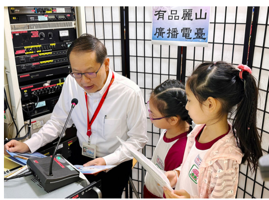
▲有品麗山廣播電臺，校長和小主播說故事給全校師生聽。

本校以「麗山三好·品德共好」為主題，配合聯合國永續發展目標 SDGs，規畫辦理多項「三好校園」系列活動與課程。其主軸為創活自我、成就他人及全球關懷三大面向，結合聯合國永續發展目標 (SDGs) 中的 SDG4 優質教育、SDG12 責任消費及生產，辦理各項活動與課程，持續將三好精神落實於校園。