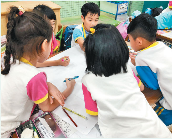
▲文化國小學生一起參與快樂國王的課程活動。

擔任班級導師的工作已經二十五年了，在少子化的現代家庭結構，和二十年前相比，有著很明顯的相同與不同。相同的是學生都能找到讓自己快樂的方式；不同的是，過去學生的快樂像士兵，人多才好玩，現在學生的快樂像國王，得要滿足自己的要求才好玩，多了自我，卻少了尊重。