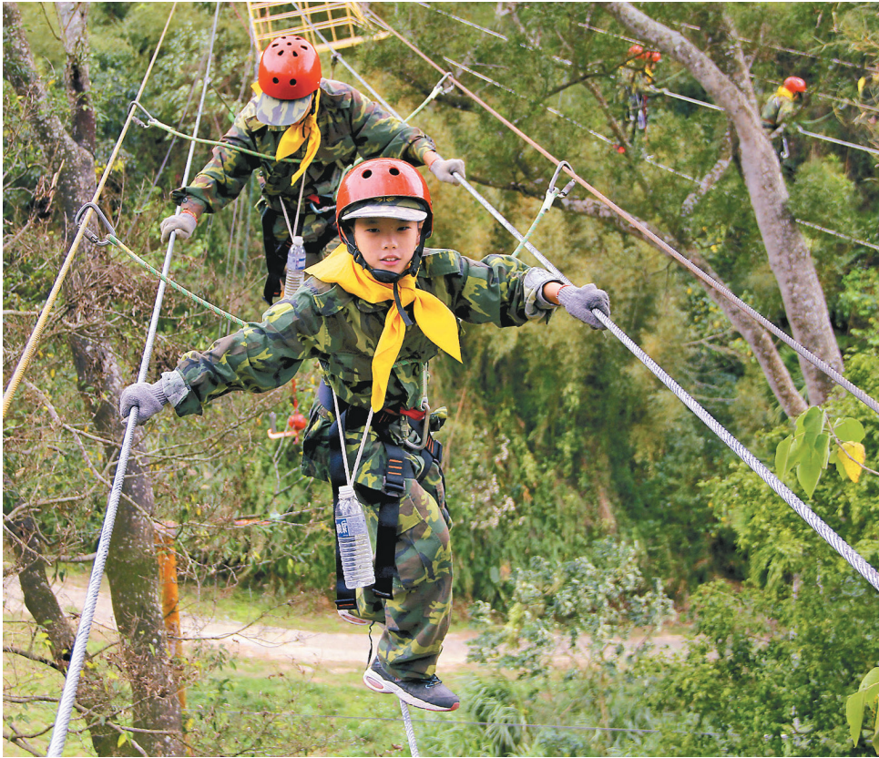
▲高空走繩及滑索看似危險，只要設施完善、裝備齊全，還是非常安全。

提到戶外活動，有不少人喜歡享受在自然環境中紓解壓力，平靜心靈。在戶外陽光下活動，身體還能產生每天所需的維生素D，加強免疫力，改善視力，促進腦內啡的分泌，產生多巴胺，抗憂鬱，維持好心情。研究顯示，戶外活動真的能帶來上述諸多好處，提升身心健康，培養積極的生活態度，甚至學習如何面對災害與解決問題的能力。因為戶外活動帶來諸多的美好，使得近年來有越來越多人喜歡從事戶外活動，進行自然體驗，甚至從事冒險探索活動。