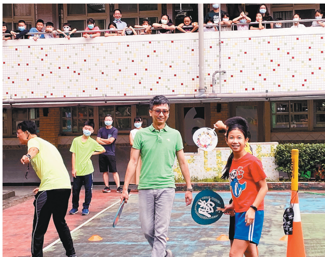
▲六年級學生在教師節策劃的敬師盃匹克球賽，充分展現品德教育服務學習的利他價值。