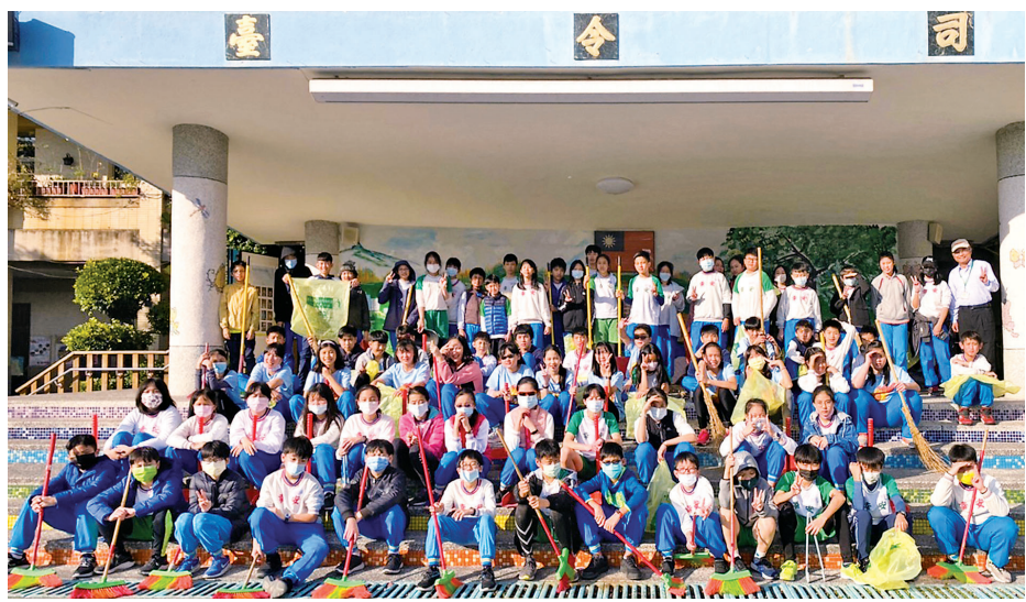
▲在國家清潔週，幸安國小學生打掃校園周邊，維護社區環境清潔。

「團隊力量大」生動道出一個人本領再強，也抵不過一個團隊發揮眾志成城的力量。「團隊合作」被列為核心素養之一，是每個人適應現在生活及未來挑戰的關鍵。不能合作的團隊，就像航行於大海中的輪船，失去動力與方向，盲目漂流無法靠岸。團隊合作如此重要，那麼「團隊合作」的意義為何？成功「團隊合作」有何特徵？又如何增進「團隊合作」的素養？ 一、「團隊合作」的意義：一群人為達成同一目標，過程中相互支持，攜手合作完成共同的任務，就是「團隊合作」。例如：在學校一起打掃教室，在舞臺上舉辦音樂發表會，球場上的籃球比賽、跑道上的大隊接力賽等，以協作方式，適才分工，發揮所長，共同完成任務，都是「團隊合作」的實踐表現。 二、成功團隊的特徵 ：經過學者研究後發現，成功團隊同時擁有五種特徵： 1. 目標一致：成員必須明確，成為更好的自己。 2. 共同目標，合力達成。信任夥伴：「信任」是團隊合作的基石，每個成員都要信任對方才能完成任務。 3. 團隊氣氛：每個成員都應相互支持包容、欣賞其他成員的優點與好表現，營造良好團隊氣氛。 4. 有效溝通：以有建設性與尊重彼此的方式進行溝通協調，溝通過程激盪出火花，並能得到最好的解決策略。 5. 團隊紀律：遵守團隊工作要求和工作紀律。 三、增進團隊合作的素養： 1. 讓自己成為具有團隊合作精神、能與他人合作的人。 2. 溝通能力：有效的溝通，是能傾聽也要能有效回應。遇到衝突或矛盾，也能控制情緒、理性分析，採取適當行動解決問題。 3. 團隊承諾：對於團隊中分派的任務，能竭盡全力，使命必達。若遭遇困難會尋求協助一起克服，絕不輕言放棄。 總之，團隊合作是成功的密碼，是現代人不可或缺的核心素養。讓我們一起修練「團隊合作」的知識、能力與態度，成為更好的自己。