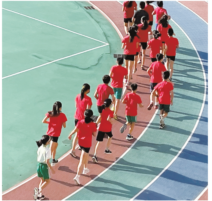
▲東湖國小田徑隊每天進行團隊訓練。

清晨，東湖國小的操場上陸陸續續來了一名又一名穿著運動服的學生，不分平假日與寒暑，這已是他們的日常。維持這份熱情，就是同儕「團隊合作」的精神，其中有幾項要件： 首先是「自我要求」：所有選手都是自發前來參加集訓，沒有遲到與早退的問題，一名懂得自我要求的選手，自然會在訓練中不斷的督促自己努力達標，期盼自己成為團隊的領頭羊。 其次是「積極進取」：專注運動技巧的提升，同時也要懂得不斷反思進步