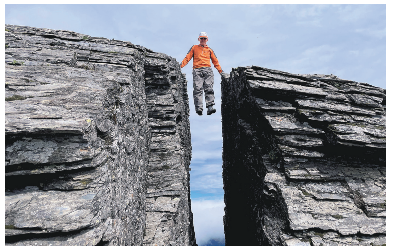
▲看似簡單的動作卻有高風險，非專業或沒受過訓練千萬不能貿然嘗試。

最後，特別提一個很重要的觀念：風險自主管理與責任自負態度。戶外活動在自然天地間本就潛藏許多風險，因此風險自主管理與責任自負是從事或選擇戶外活動者應有的公民素養與觀念。一個成熟的人要懂得為自己行為負責，做好充足的準備才出發，期待我們一起成為成熟的戶外活動人！