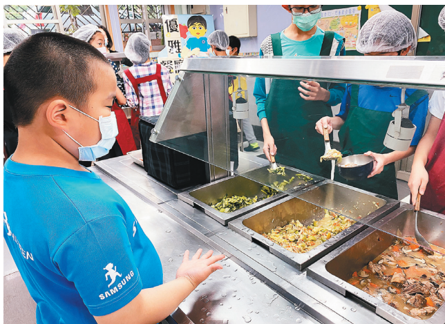
▲高年級學生發明給量手勢，讓全校學生在打菜時可以減少廚餘。