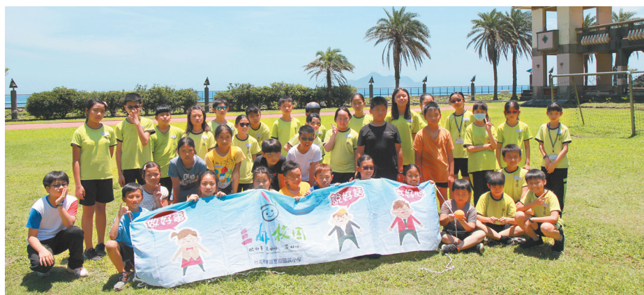
▲雙園國小舉辦三好校園「微夢想的旅行」活動。

「君子慎獨，不欺暗室」，點出品德讓人懂得自處，改變了社會、國家，期望品德教育最終能藉由重塑每個國家，而造福全世界。