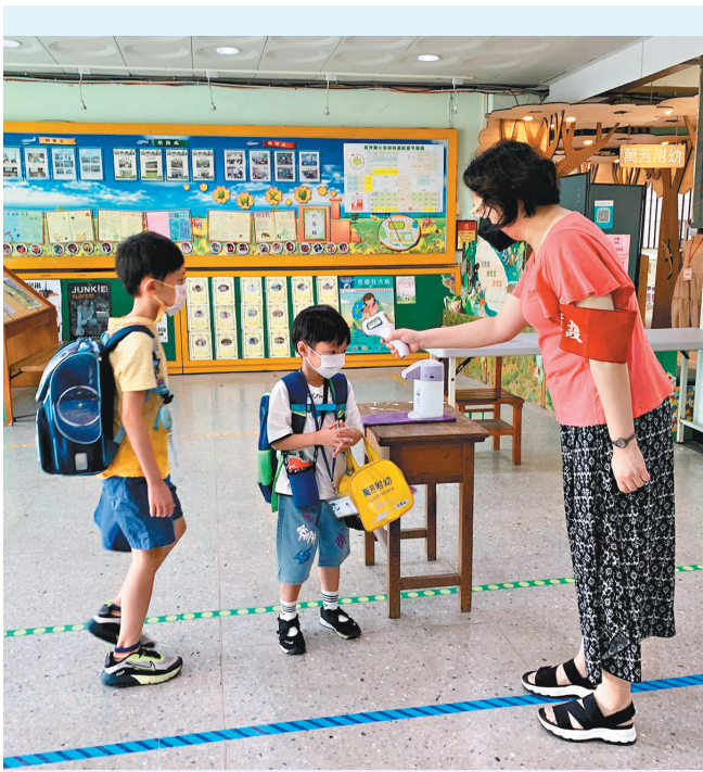
▲萬芳國小教師為學生量測體溫。

配合。因此，教師反覆透過班級經營、領域教學及集會活動，向學生說明這件事的重要性，並提醒每個人應承擔的態度和責任。同時也告知家長，請學生自主量測體溫的目的在於培養學生「自主與自律」品德。 學務處師長持續檢視執行細節並適時微調，如：開放未貼體溫貼紙的學生補量，但須自主將結果登錄在特殊貼紙上，方便班級教師辨識。教師如果發現班級補量測人數有增加趨勢，就會提醒學生。班級教師回報體溫時，也會主動將遲到學生補登錄的體溫數據重新上傳，所示範的「自主與自律」行動，足為學生表率。 現在學生進校門時，會主動把手臂舉起，出示體溫貼紙供導護教師查驗；未量測體溫的學生，也會主動告訴教師並接受補量測，還會覆誦度數以便入班後自主登錄。新湖的「體溫自主量測」行動，是全校親師生協力實踐「自主與自律」行為的最佳例證，不但成功守護了每個人的健康，也無形中為學生培養了更厚實的競爭力。