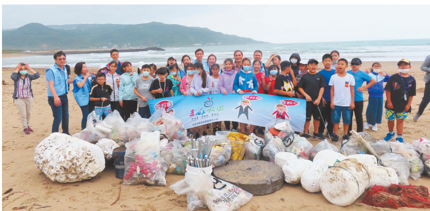
▲雙園國小帶領學生到海濱進行淨灘活動。