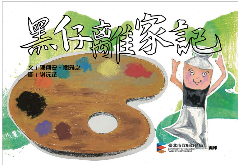
文 / 陳俐安、關雅之 圖 / 謝沅芷 臺北市教育局 DEPARTMENT OF EDUCATION TAIPEI CITY GOVERNMENT