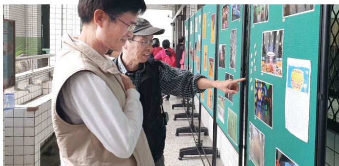
▲宜蘭縣二城國小藝文領域教學深耕計畫舉辦攝影美展。

戶外教育課程如果設計得當，走出教室外的學習，可深化學科學習，甚至培養出跨領域統整的能力。期待學務主任能透過參訪，協助學校在規畫校外教學時，結合他校的特色課程設計經驗，使學生透過親身探索引發驚奇和趣味，提升學習動機。