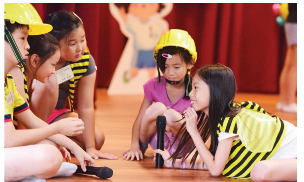
▲ 表演過程中，學生扮演可愛的小蜜蜂，開心討論如何過冬。

發展課程展現自我 隨著十二年國教上路，教師的首要任務，即是本著「自發、互動、共好」的理念，將學生培育成主動積極，能與他人合作，願意付出的學習者，並以「素養」為教學與評量的導向，使學生能將課程中所學到的知識、情意、技能，實際運用在生活中。而忠孝國小舉辦的品德及人權教育戲劇學習營，讓學生樂於求知，樂於學習，並能實際運用所學，為十二年國教的教學做了良好的示範！