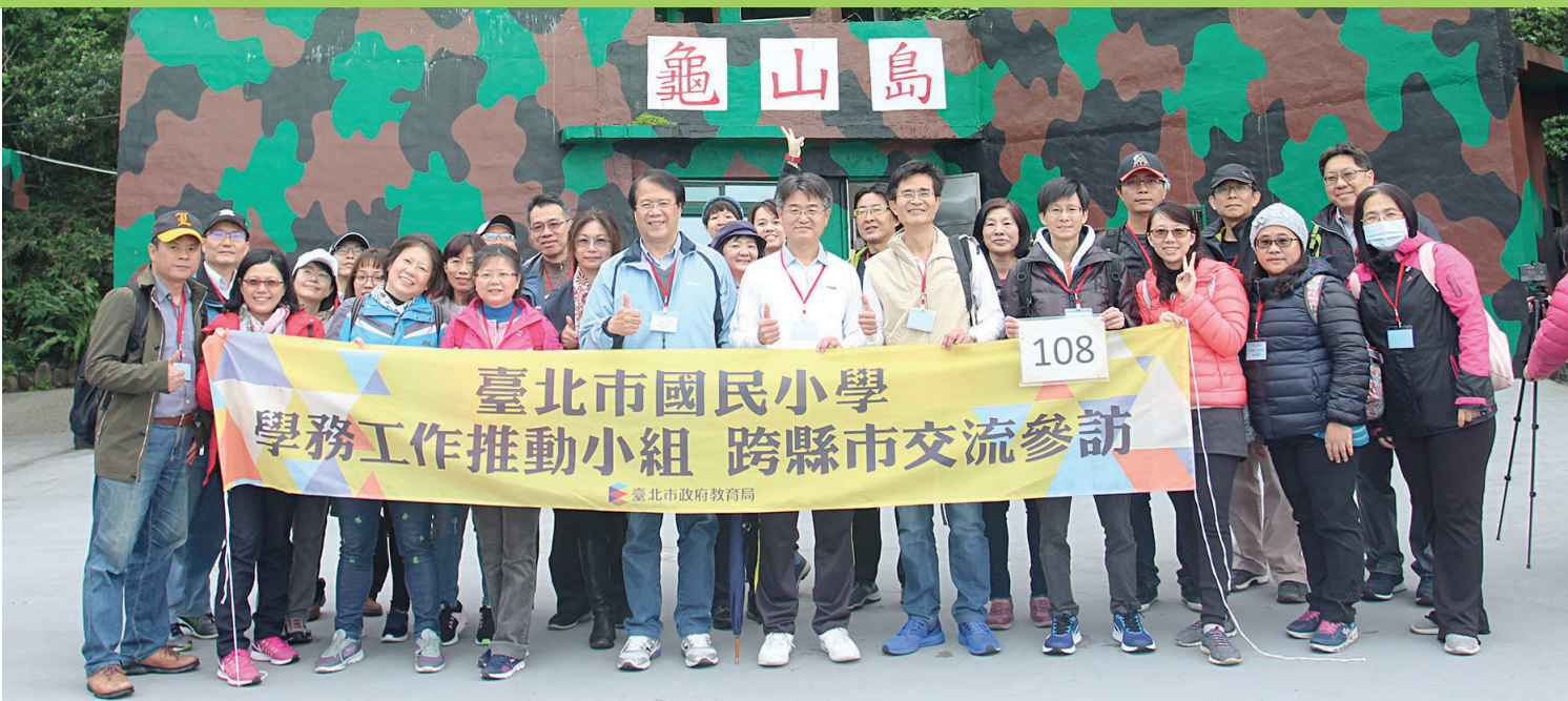
參訪團登龜山島探索地質、地形與地貌生態。參訪團到北海岸富貴角燈塔、老梅綠石槽探訪。