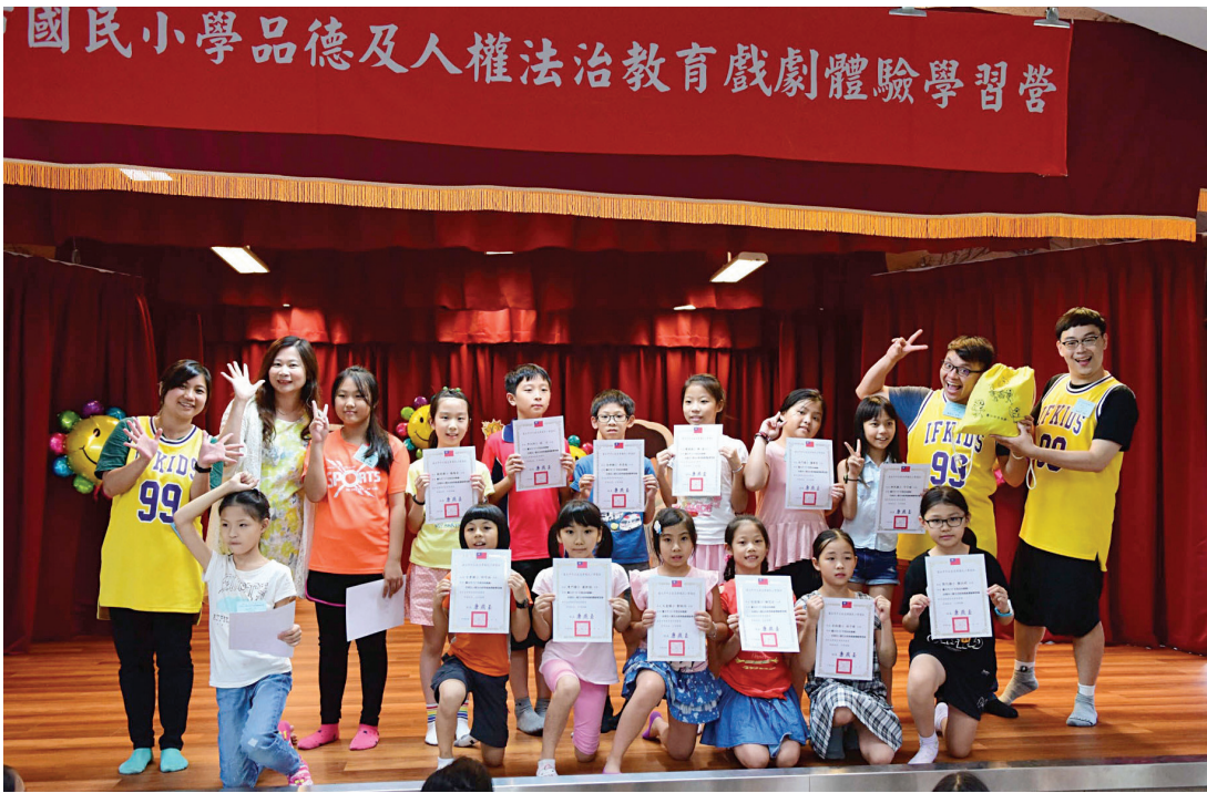
▲ 成果發表會後，教師與獲獎學生合照。

由臺北市政府教育局主辦，臺北市忠孝國小承辦的「品德及人權法治教育戲劇體驗學習營」，每年都會在七月初舉行。戲劇體驗學習營的推動目的，一方面是為了增進學生對當代品德核心價值及其行為準則的認識，從戲劇活動中，學習思辨、選擇與反省，進而產生認同、欣賞與實踐的能力；另一方面，期待經由體驗活動提高