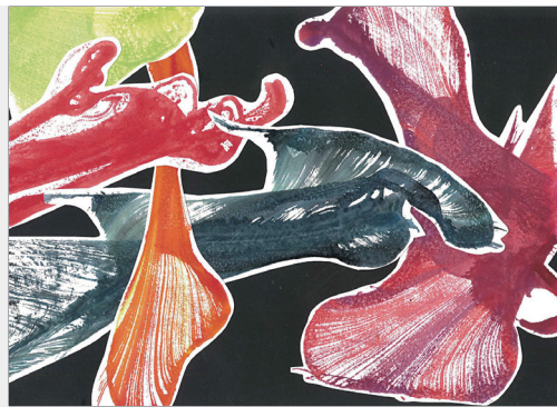
《黑仔離家記》的封面與封底，這本書傳遞團結力量大的道理。