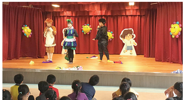
▲ 各小組的成果發表演出。