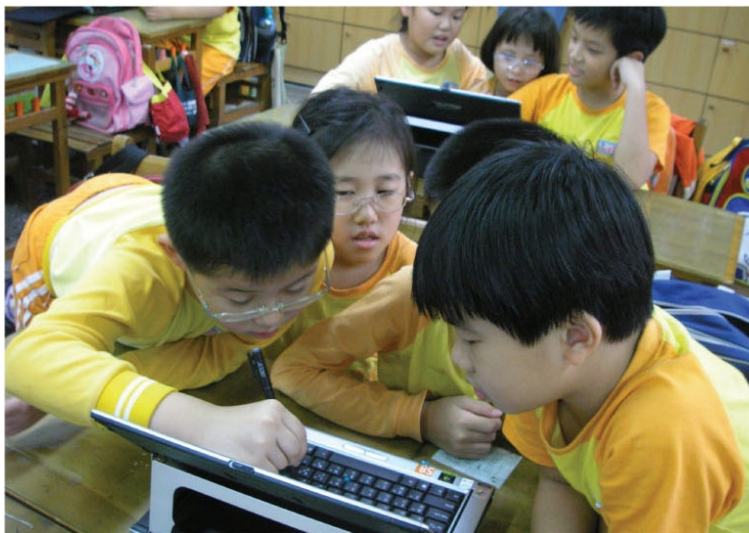
▲利用平板電腦將投票及溝通結果上傳全體討論。

「品德小故事」得獎作品全文請上 http://tmw5.tmps.tp.edu.tw/personality/