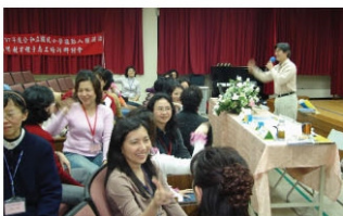
▲講師帶領志工實地操作，學習具體的教導策略。(天母)

在實務方面，亦提供繪本賞析、演說故事、嘉言短語、戲劇表演等具體方法。承辦學校表示活動設計強調理論實務兼備，深獲家長好評；學員對於形式多樣、方法多元的品德教育推動方式，皆頗有領悟。