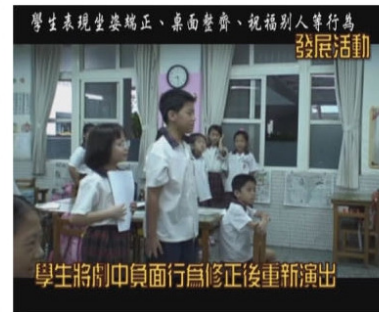
▲學生將劇中負面行為修正後重新演出。