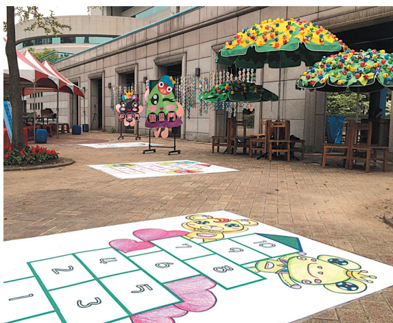
▲三興國小——旅行·智慧·夢想門，夢想在腦海中逐漸生根。

創作媒材包含：木椅、大雨傘、傘架、竹掃把、木條、飛機木、卡點西德、光碟片、塑膠球、塑膠風車、樹脂土、保麗龍膠、棉繩、鐵絲、魔鬼氈。