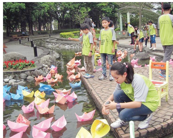
▲學生參與「坐大船出去玩」體驗活動，滿足了對於遠行與冒險的想像。（關渡／吳文德）

現本市學生的幸福學習生活，以小小背包客在臺北城市的旅遊體驗學習為形象的呈現。整體活動規畫透過會議討論及專家教授指導，從作品表現的可能性及與環境材料融入整合的適切度思考。透過體驗探索的方式，提供學生與家長體驗地景藝術創作表現的機會。活動當日上午，由各學校教師帶領學生在現場創作，下午則邀請市民及學生一同參與。在操作與互動過程中，共同創作出具有創作意涵及視覺效果的作品，並協助親子拍照，留下難忘的回憶。