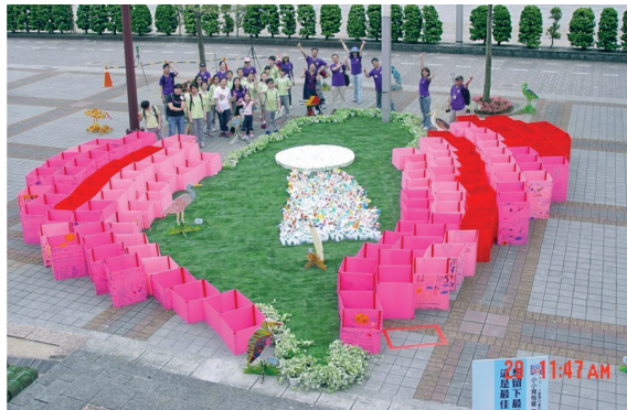
▲麗湖地景遊趣——「臺北·轉動的 i」正式啟動，將愛與關懷傳遞全世界。

創作媒材包含：韓國草坪、黃金葛盆栽、風車、回收牛奶瓶、回收瓶、塑膠瓦楞板、白鷺鷥造型板。