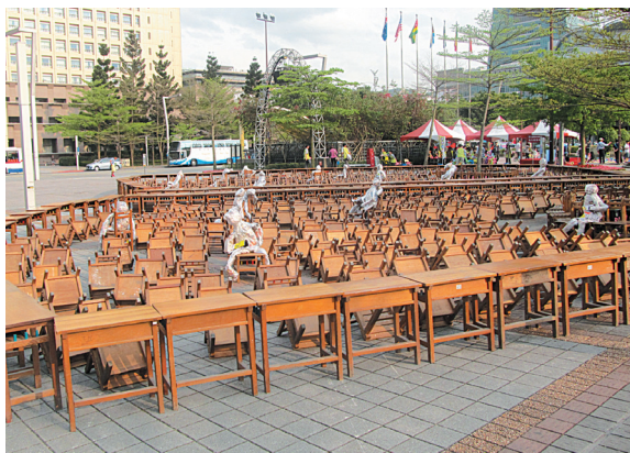
▲五常國小創作「旅行·閱讀·幸福 N 次方」，用書本與現場環境的大樹結合，書本如魔法般的使旅程生動起來。（五常／陳佳實）