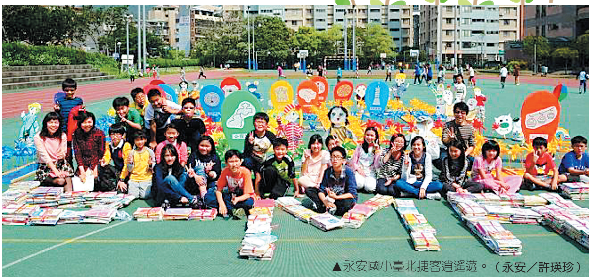
▲永安國小臺北捷客逍遙遊。（永安／許瑛珍）

創作媒材包含：學生課本、回收衣物、空寶特瓶、PP 塑膠瓦楞板、氣球支撐桿（約 36CM*2mm）、角條、旗座。