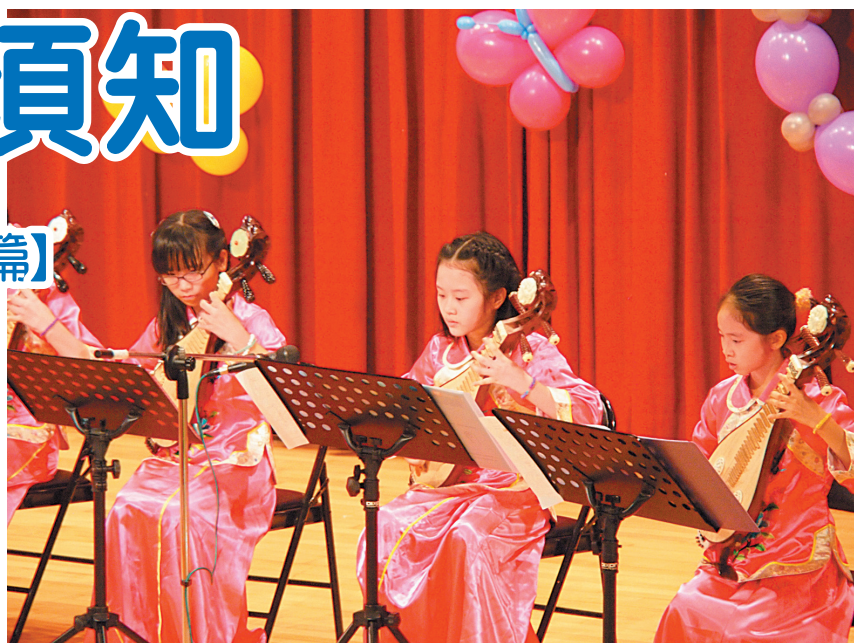
▲利用休閒時間，培養藝術興趣，提倡正當娛樂，至今仍適用。

特別值得重視的現象，顯現在條目 3、4、5、6 上。條目 3：要養成多數人服務，「先之勞之」的美德。條目 4：養成是非心，要仗義執言；養成同情心，能急人之急。條目 5：見人傾跌，不可譁笑，須予扶持，先人鬥毆，不可助虐，須予排解。條目 6：不容許孤立自私，投機取巧，偷惰怠忽；尤不容許貪人之功，以為己有。這四項條目，學生認為仍適用的比率高於家長和教師。而這四條目，主要強調人與人之間彼此扶持，互相協助，對別人保持同理心，立志為他人服務，同時教導國民與