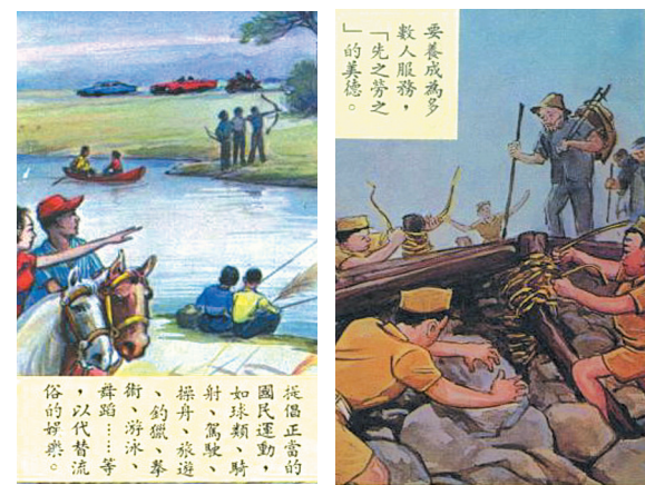
▲70 年國民生活須知畫冊開隅。