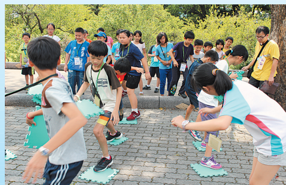
↑品德補給站進行勇闖毒龍潭。