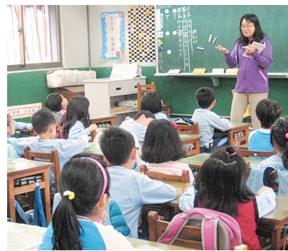
↑ 故事媽媽晨光說故事。