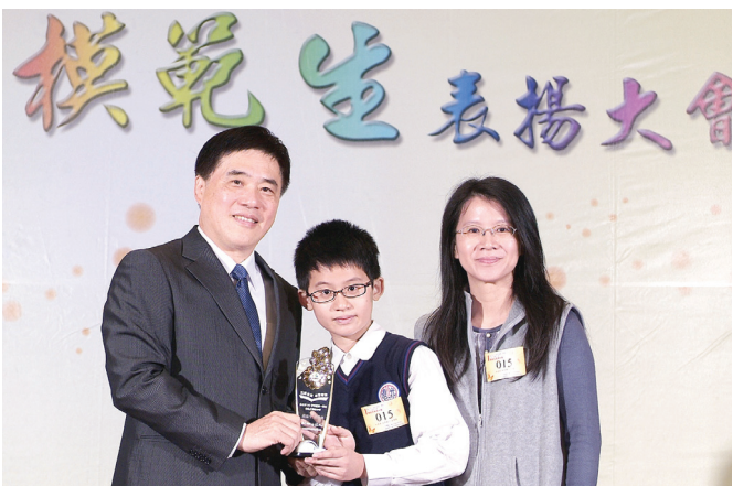
↑光復國小的高藝展(中)與郝龍斌市長(左)合影。