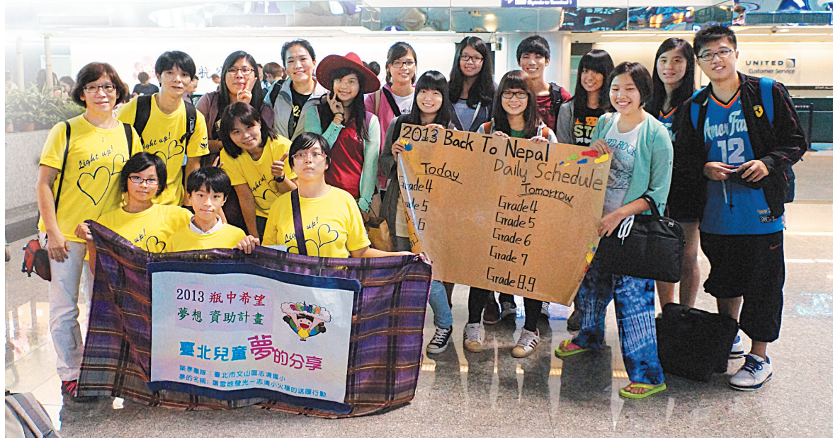
↑出發前，與國北教大的大哥哥、大姐姐合影。 →雪地的學習環境差，當地的學生僅能藉由牆上的採光洞透進來的光線寫作業。

從臺北飛加德滿都約8小時，但是兩校的學習環境差距卻有數十年之遙；操場地面不平整，下雨會處處積水，更凸顯它的坑坑洞洞，不像志清的合成橡膠跑道，平坦舒適；班級教