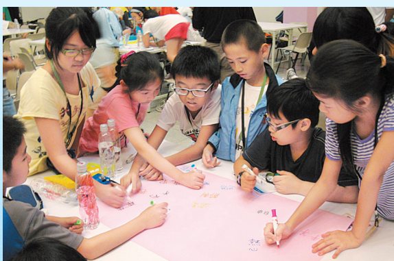
↑品德補給站進行小組討論。

在閉幕典禮上，頒發了「最佳團隊獎」、「最佳學習獎」、「最佳負責獎」、「最佳活力獎」鼓勵每一個小隊的用心參與和認真學習，在依依不捨的道別聲中，大家踏上歸途，也期待明年再相見。 (雙蓮／劉心君)