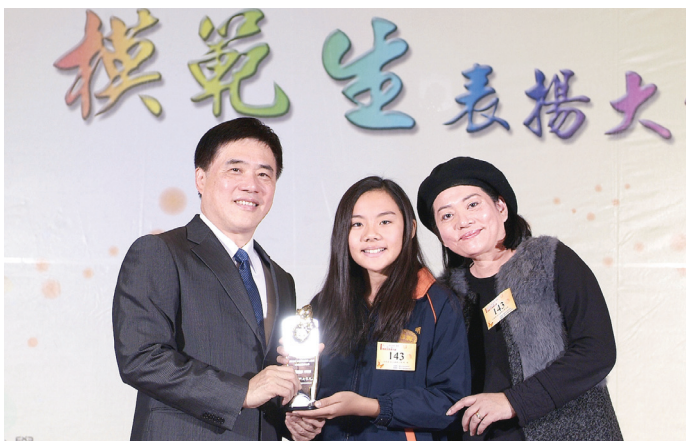
↑華興國小的明明(中)與郝龍斌市長(左)合影。

臺北市 102 學年度第 1 學期公私立國民小學模範生表揚大會由新和國民小學承辦，已於 2013 年 12 月 13 日舉行。表揚大會在本市成軍已久且頗負盛名的天母國小管樂團演奏〈頑皮豹〉、〈美女與野獸〉、〈不可能的任務〉及〈風河〉四首曲子的精采表演中展開序幕，來自全市公私立國民小學的 156 名模範生代表，由市長郝龍斌逐一頒發獎座，接受表揚。