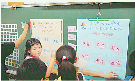
小朋友參加人權闖關活動，挑戰品德賓果樂園。