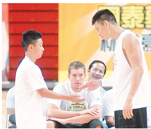
↑↔ 林書豪與籃球訓練營的小朋友，示範「書呆子打氣法」。

家長特別喜歡林書豪「時時感恩」的特質。家長認為，每當林書豪得分時，總是歸功於隊友，並把所有的榮耀歸給上帝。如果表現不好，陷入低潮，甚至受傷了，他也不怨天尤人，會時時自省，向目標邁進。家長表示，林書豪的感謝上帝，跟陳之藩強調的「謝天」相近，也認為林書豪能有這麼好的特質，是因為他的信仰堅定，家教甚好。