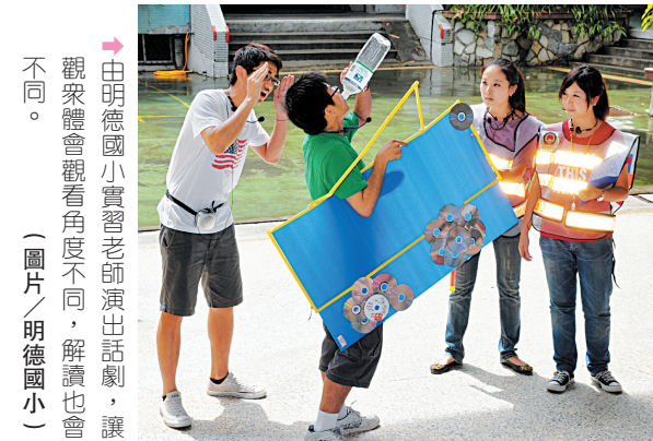
▶由明德國小實習老師演出話劇，讓觀眾體會觀看角度不同，解讀也會不同。 (圖片/明德國小)

藉由教師實際教學後，並實際到大賣場針對民眾進行訪問，最後並經由專家學者說明，得知：選用清潔用品時，應採取功能簡單、天然的產品，才能減少對人體及環境的傷害。 (西松)