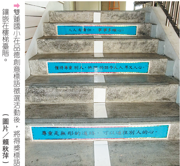
雙蓮國小在品德創意標語徵選活動後，將得獎標語鑲嵌在樓梯臺階。

雙蓮國小在加強推展人權法治及品德教育頗下功夫，學校進行師生品德核心價值問卷調查，調查結果全校師生認為最需加強的前 3 項核心價值，分別為責任、誠實、尊重，再結合臺北市 14 項核心價值，據以訂定學校推動品德教育核心價值及行為準則。復又根據品德問卷結果，進一步以責任、誠實、尊重為主題，進行創意標語徵選活動，將得獎標語鑲嵌在樓梯臺階，以擴大宣導效果。