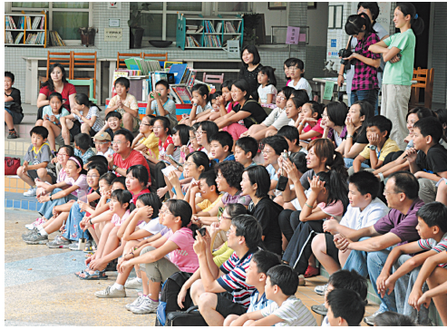
◀師生一起參加媒體素養研習，個個聚精會神觀賞行動劇。

兩週後辦理小主播比賽，規定每隊 2~3 人進行團隊合作，以簡報軟體，結合照片、圖片、影片、文字等元素，上臺發表。經過激烈且精采的比賽後，有三個隊伍脫穎而出，獲得特優，名單如下：