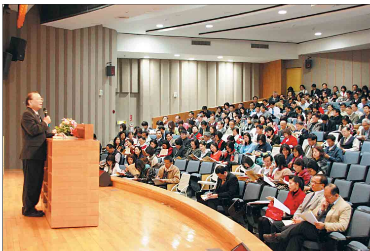
↑本市 284 位各級學校校長，投入防制校園霸凌。