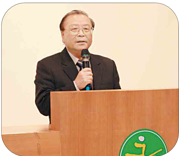
↑康宗虎局長強調隱瞞霸凌事件並不能解決問題，教育人員應該誠實溝通交流，並共同防制、輔導與處理。

「霸凌」一詞，是藉英語「bully」音譯而來的，指「欺凌」或「暴力」。世界各國校園霸凌的現象相當普遍，更是長期存在的校園問題，國內亦然。近日桃園縣八德國中事件，讓此議題再度受到國人高度重視。