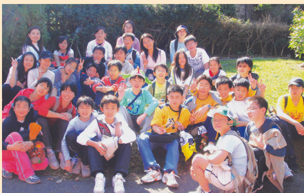
天母古道健行活動，是每年天母國小六年級畢業系列活動之一。

臺北市位在臺北盆地一側，四周群山環繞，也是世界上少數具有自然景觀特色的生態城市，豐富多樣的自然特色，提供民眾舒適安全與便捷的親山環境，臺北市政府規畫一系列親山步道系統，整合社會資源，營造健康、活力的生態城市，以提升民眾的生活品質。