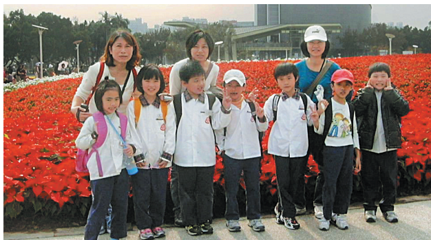
▶小朋友和家長在由聖誕紅妝點而成的美麗花海前留影。

因此，為提供學生更豐富多元的學習機會，除了在票價上有相當的優惠外，教育局還建置教學資源網，讓各級學校可以充分運用，發揮遊花博的最大效益。花博教學資源網網址為 http://2010taipeiexpo.tp.edu.tw 。