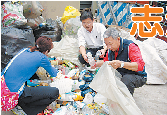
↑ 環保站也是材料募集的好地方。

志清國小於 97 學年度開始，積極開發「環保藝術」課程，並在創作歷程中，涵養品德與藝術的價值。這是一個新鮮的創舉，更懷抱著下列的想法逐步開展：