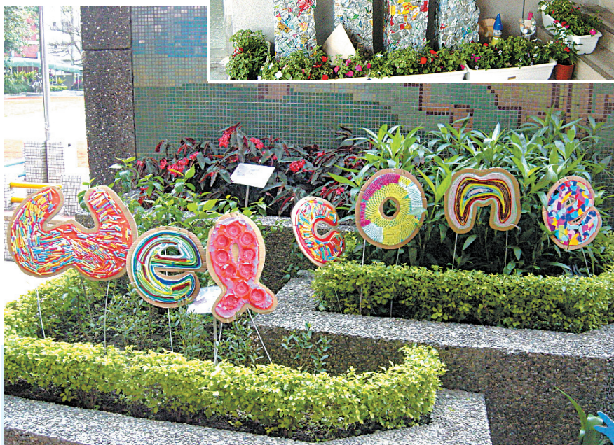
↑ 學生的環保藝術創作，是校園裡最動人的陳列品。