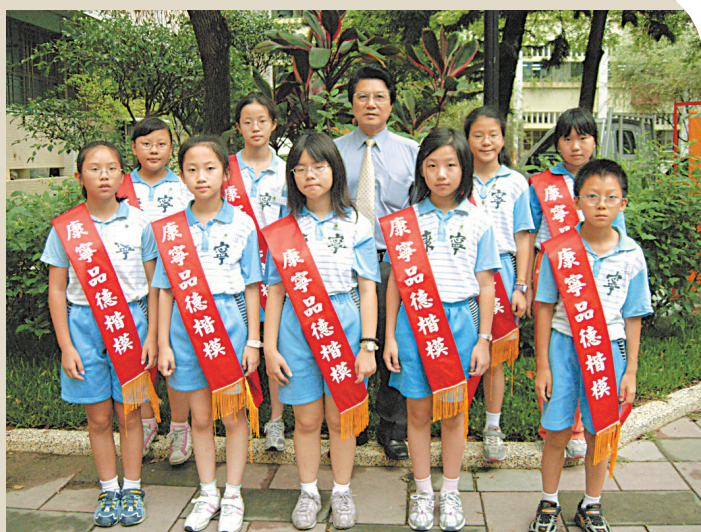
↑ 每班推舉「品德楷模」，領取獎狀接受表揚，學生視為最高榮譽。